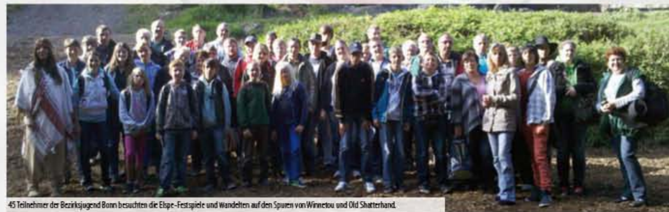
45 Teilnehmer der Bezirksjugend Bonn besuchten die Elspe-Festspiele und wandelten auf den Spuren von Winnetou und Old Shatterhand.