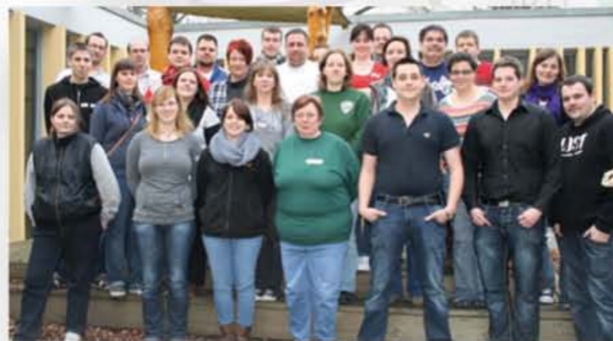
Die Teilnehmer der Zusatzqualifikation Bezirksarbeit waren motiviert und mit viel Spaß bei der Sache.

Am Samstagmorgen, nach einem ausgiebigen Frühstück und dem ersten Morgenimpuls, ging es mit Geschichte, Ziele und Aufgaben des BdSJ, Recht und Verantwortung sowie Kommunikation durch den Tag. Am Sonntag erfuhren wir etwas zu Jugendpolitik und die Finanzierung der Jugendarbeit bis dann die langersehnte Prüfung kam, die alle mit Bravour bestanden. So