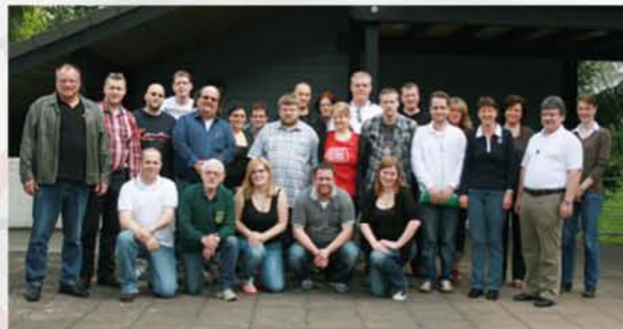
Die Teilnehmer der Zusatzqualifikation Bezirksarbeit waren motiviert und mit viel Spaß bei der Sache.

Gestartet sind wir am Freitag mit einem Interview zum Kennenlernen – das war