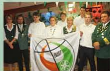
75 Jahre Jugendabteilung wurden in Altendorf gebührend gefeiert.