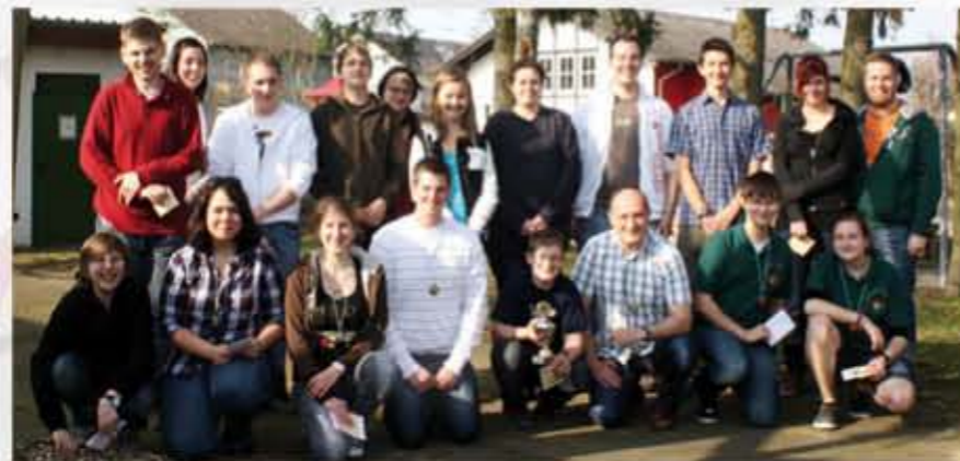
Die Schüler- und Jungschützen des Bezirksverbandes Voreifel hatten viel Spaß bei ihrem Treffen in Wormersdorf.