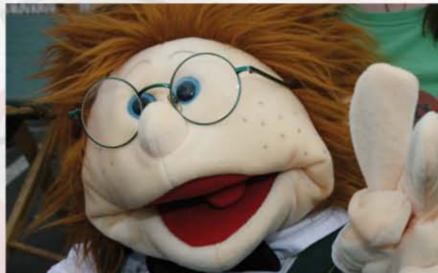
Jetzt bin ich da!!

Jungschützen der St. Sebastianus Schützenbruderschaft Balkhausen-Türnich, die die Organisation eines Seniorencafés übernommen hatten, oder die St. Sebastianus Schützenbruderschaft Pützchen für viele engagierte soziale Projekte im letzten Jahr. Der erste Platz macht mich schon stolz, den die Jugendlichen der St. Hubertus Schützenbruderschaft Unterbach 1870 e.V. haben in Kooperation mit dem Gymnasium vor Ort jungen Menschen den Schießsport und das Schützenwesen näher gebracht. Auch die Bezirke hatten sich Gedanken ge-