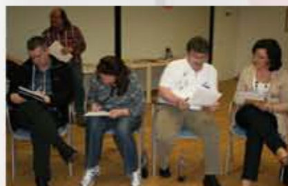
Auch alte Hasen konnten viele neue Ideen mitnehmen.

Dieses Wochenende war mal wieder echt viel los, das kann ich dir sagen. Ich komme nämlich grade aus Walberberg vom Aufrischungswochenende für Jugendleiter und Jugendleiterinnen im BdSJ, die schon seit mindestens fünf Jahren ihren Jugendleiterausweis haben. Da waren aber auch viele, die schon wesentlich länger Jugendarbeit bei den Schützen machen. Wir