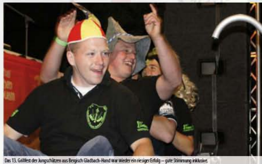
Das 13. Grillfest der Jungschützen aus Bergisch Gladbach-Hand war wieder ein riesiger Erfolg – gute Stimmung inklusive.

ren die Wetterprognosen so gut wie nie für uns. Umso mehr Spaß machte es während der Vorbereitungen beim Aufbau. Die große Bühne wurde aufgebaut und