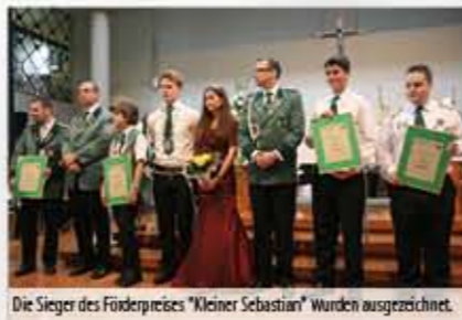
Die Sieger des Förderpreises "Kleiner Sebastian" wurden ausgezeichnet.

macht und so wurde der Bezirk Voreifel für seine hervorragende Presse- und Öffentlichkeitsarbeit geehrt.