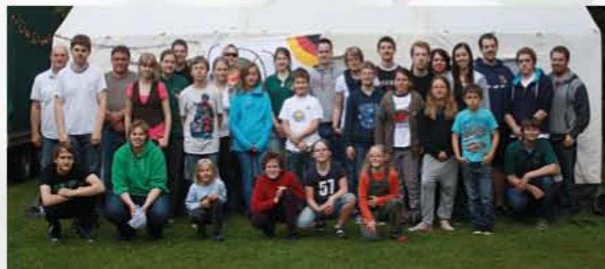
Das Zeltlager in Manderscheid war trotz Regen und Schlamm für alle Teilnehmer ein tolles Erlebnis.

des Wochenendes lautete „Mittelalter im Naturpark Eifel“. Über 30 Teilnehmer reisten an, um gemeinsam ein tolles Wochenende zu verbringen.