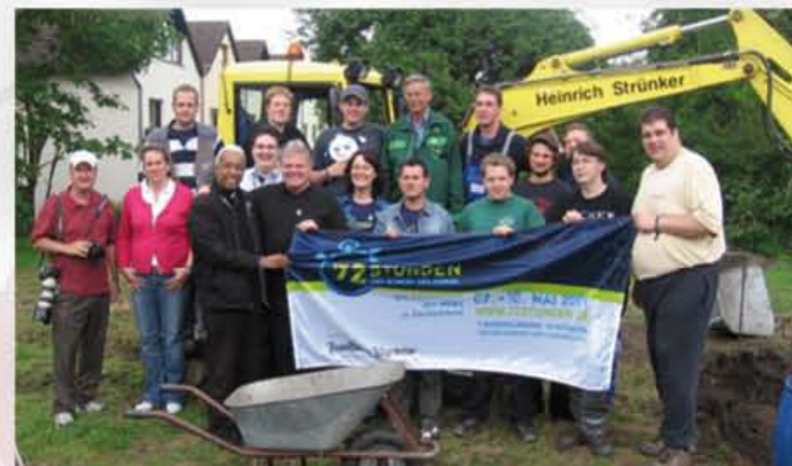
Bei der 72 Stunden-Aktion 2009 verschönerte die Schützenjugend den Schulgarten.